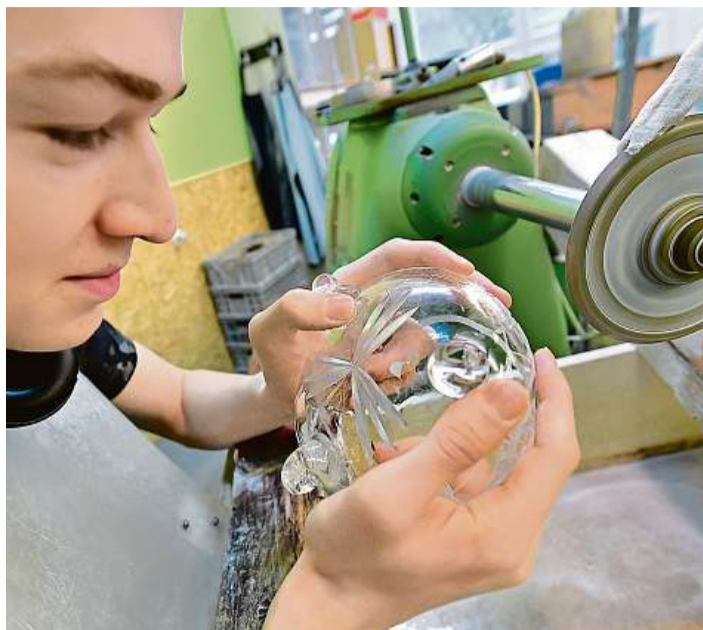
Brusič skla Příkladem dobré školní praxe může být i broušení skla, kterému se učí studenti průmyslovky ve Světlé nad Sázavou.

které na pracovním trhu chybějí dlouhodobě, je snaha firem zavázat si žáky už během studia stipendii.